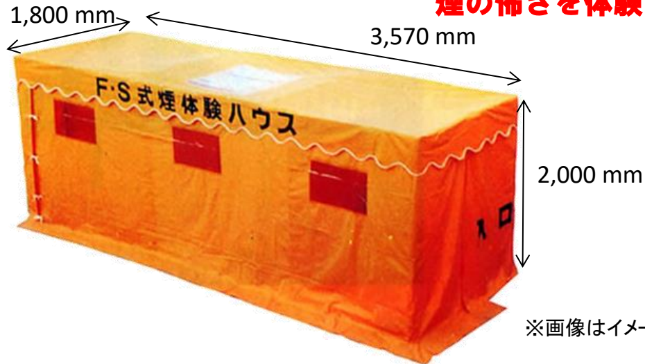
※画像はイメージです

当社の煙体験ハウスは、煙がどのように動くのかを目で見て確認して頂くために、オレンジ色の生地を使用しています。